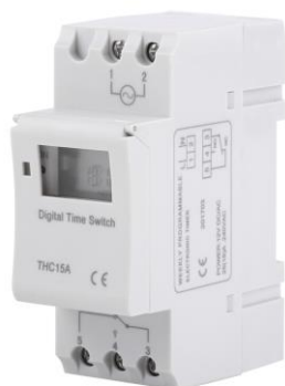
Diagrama de conexión: